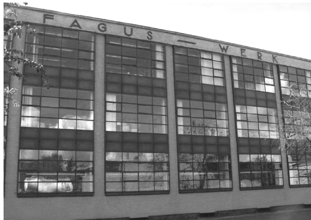
图4 德国法古斯工厂幕墙立面

城市型燃机电厂主厂房是主要建筑，体量庞大，立面需要进行重点处理。设计师可采用民用建筑的立面设计手法来对主厂房立面进行处理，对立面材质的变化需求较其他类型电厂多，因此石材、玻璃及金属板幕墙也会进入设计师的选择范围内，如图4的德国法古斯工厂采用的幕墙立面。