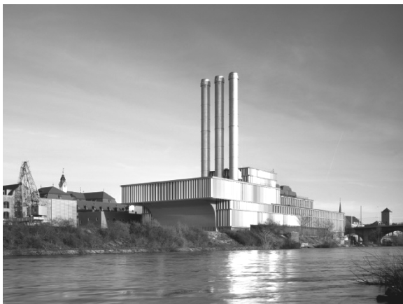
图1 德国维尔茨堡发电厂

燃机电厂按其所在区位可分成两种情况：一种是燃机电厂原来是处于郊区或者是城市边缘地带，由于城镇化建设，城市不断扩张，吞并周边郊区地带，使原本属于郊区的地区也纳入到城市范围内，原来处于郊区或城市边缘地带的燃机电厂进入了城市内部，如图1德国维尔茨堡发电厂；另外一种城市规划将燃机电厂作为城市新规划区域的电力负荷中心，通常是燃机电厂先于新区域的建设，以保证能源供应与新区建设接轨，这种情形是燃机电厂未来将处于城市中心。以上两种情况的燃机电厂均可定义为“城市型燃机电厂”。