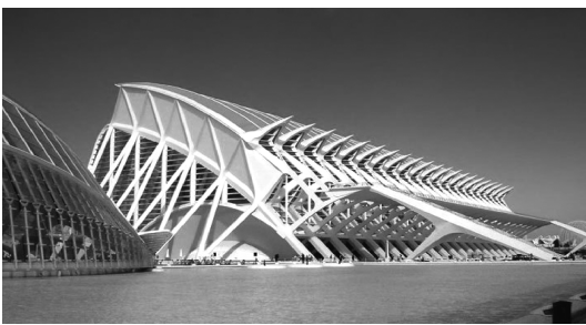
图5 巴伦西亚科学城

3) 采用索膜、玻璃、钢材等轻质材料进行建筑造型,将索膜的自然张力美与建筑技术相结合。