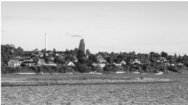
图2 丹麦罗斯基德地区垃圾电厂能源塔

如图2为丹麦建筑师埃里克·范·艾格瓦特(Erick Van Egerat)设计的丹麦罗斯基德(Roskilde)地区垃圾电厂能源塔。该塔是该地区的新废物再生能源焚烧塔。Roskilde地区新能源塔带来了除单纯工业建筑群之外的附加价值。它让这座原丹麦首都的天际线变得更为丰富,同时其特色的轮廓也是建筑历史上的经典之作。建筑下部模仿周围工厂的尖角屋顶,而上部让人印象深刻的97 m尖塔则以现代化的方式与该市重要文化遗产Roskilde教堂相呼应。