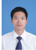
LIU G L