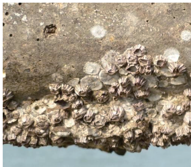
电厂取水海域海生物(牡蛎、藤壶)