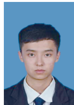
HU X X