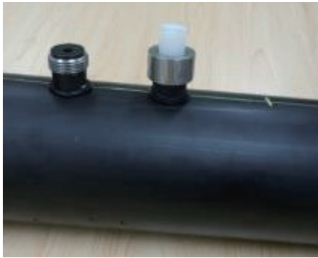
图1 喷嘴与管道安装图

沿海核电厂的运行需要大量的海水进行冷却,核电厂设置旋转滤网过滤海水保持其洁净,并配置循环水过滤系统(CFI)通过喷嘴向旋转滤网持续喷射高速水流,清洁滤网 [1] 。目前国内核电厂采用不锈钢喷嘴或进口尼龙喷嘴,而核电厂均位于海边 [2] ,不锈钢喷嘴耐海水腐蚀能力不足 [3] ,尼龙喷嘴耐腐蚀性能虽好,但耐高速水流冲刷的性能有限,需经常更换。图1为喷嘴与管道组合安装图,每台机组约200个喷嘴。图2是使用过的尼龙喷嘴图片,表1为使用前后的喷嘴孔口测量数据,可以看出,运行一段时间以后,喷嘴由于磨损,初始的扇形流道磨损严重,出现不同程度的扩孔,从现场情况来看,磨蚀严重的喷嘴喷射出的水流不再呈现扇形分布,冲洗范围不能覆盖滤网的完整截面,不利于鼓网冲洗,使滤网堵塞的可能性增大。此外,目前核电厂所采用的尼龙喷嘴为进口产品,价格昂贵,供货周期长。