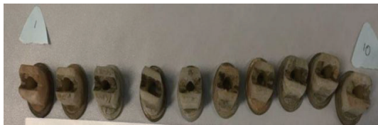
图2 使用后的尼龙喷嘴