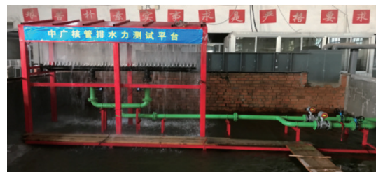
图3 整体水力学试验装置

为验证喷嘴的水力特性参数,建造水力试验台架,开展了43个喷嘴的大型水力试验,用于测量喷嘴的流量压力数据 [13] 。试验台架如图3所示,通过测量得到各压力下的流量数据。结合某核电厂的系统配置数据,采用AFT Fathom软件对CFI系统进行水力学建模,详细模拟系统的泵、阀、喷嘴、管道管件等部件 [14] ,将喷嘴流量压力试验结果数据代入AFT水力学模型进行计算,结果表明,喷嘴的水力性能达到核电厂旋转滤网冲洗需求。